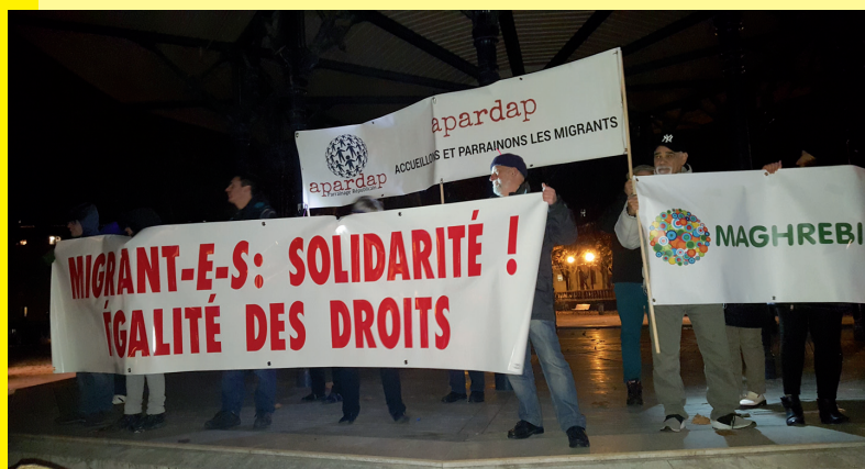
Manifestation 18 Décembre 2018 - Grenoble

Syndicat CGT des travailleurs sans-papiers