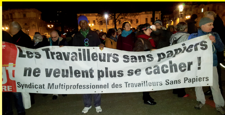
Manifestation 18 Décembre 2018 - Grenoble

2. IL FAUT SUPPRIMER TOTALEMENT LE «DÉLIT DE SOLIDARITÉ» . Quelques avancées ont eu lieu l'été dernier, mais il y a encore des camarades dans les Hautes-Alpes, dans les Alpes-Maritimes qui sont poursuivies par la justice. La population de ces régions frontalières a