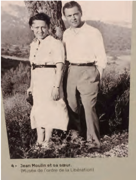
4 - Jean Moulin et sa sœur.