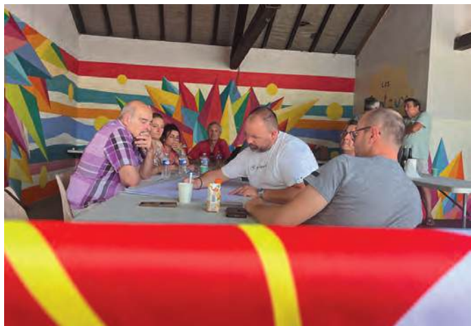
après-midi - atelier 2