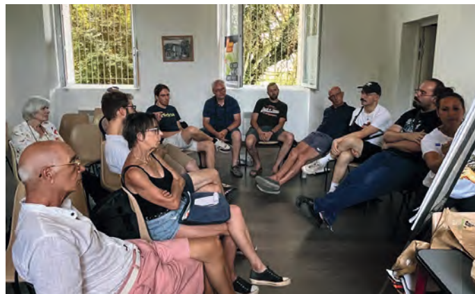
après-midi - atelier 1